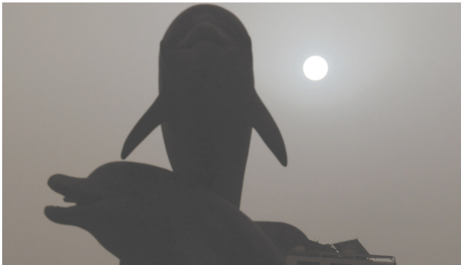
Μία απόκοσμη ατμόσφαιρα επικράτησε χθες στο Ηράκλειο