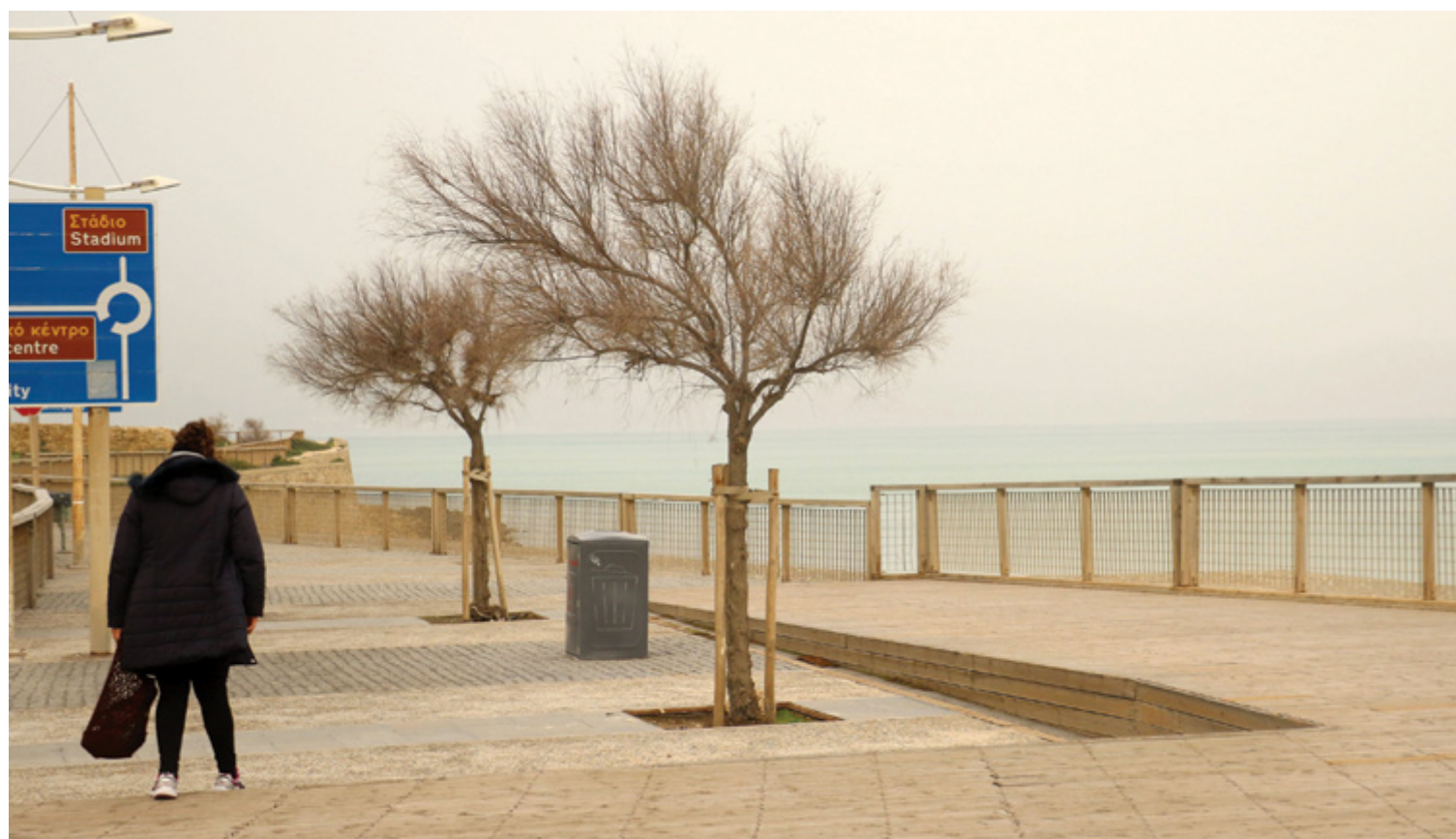
Οι ισχυροί άνεμοι επιβάρυναν την ατμόσφαιρα και δυσκόλεψαν τις μετακινήσεις

Αύριο, Κυριακή, νωρίς το πρωί προβλέπεται καιρός με πρόσκαιρα αυξημένες νεφώσεις, το μεσημέρι πρόσκαιρα αυξημένες νεφώσεις και πιθανότητα βροχής ενώ τις βραδινές ώρες καλός καιρός με λίγες νεφώσεις. Ο άνεμος θα είναι μεταβλητός, εντάσεως από 1 έως 3 μποφόρ από νοτιοδυτικές ως και βορειοδυτικές διευθύνσεις. Η θερμοκρασία θα κυμανθεί από 7 έως 15 βαθμούς Κελσίου, ενώ στα ορεινά από 3 έως 9 βαθμούς Κελσίου.