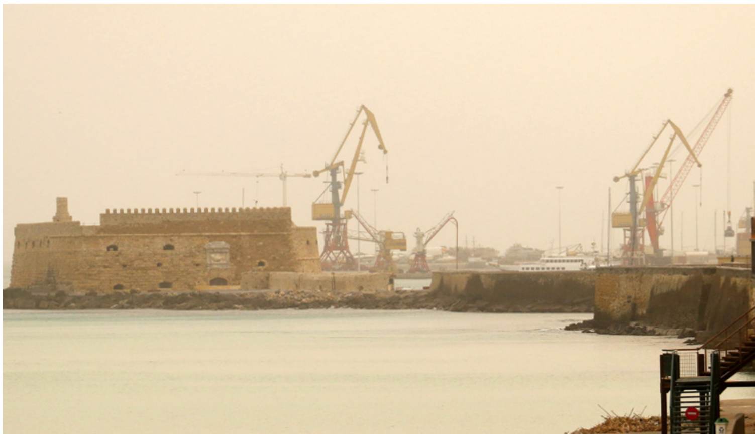
Ένα... πέπλο «τύλιξε» το φρούριο Κούλε

Η αφρικανική σκόνη ήρθε, την... εισπνεύσαμε και απήλθε για την Κρήτη! Οι καιρικές συνθήκες που επικράτησαν από το βράδυ της Πέμπτης στο νησί μπορεί να μην συγκρίνονται με όσα ζήσαμε τον Μάρτιο του 2018, όμως κατάφεραν να χρωματίσουν κίτρινη την ατμόσφαιρα.